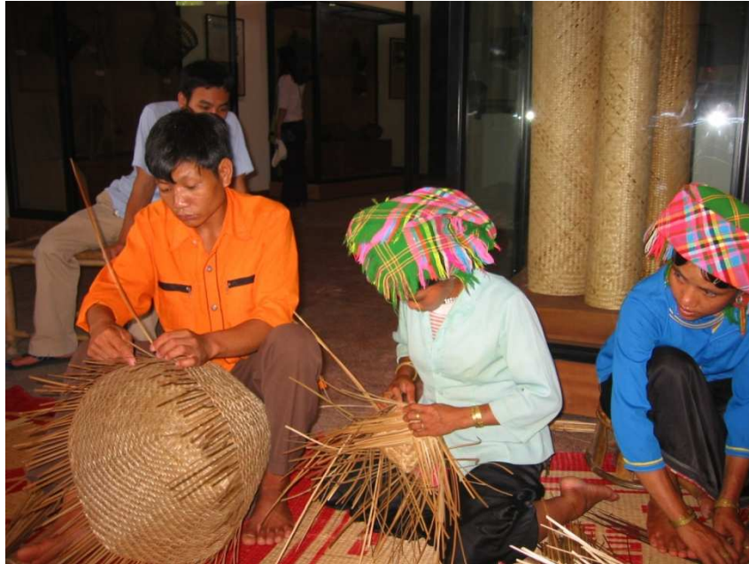
Trung bày và giao lưu với người La Ha